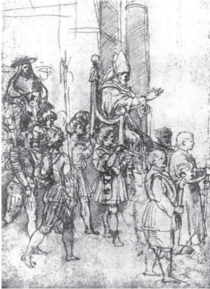
fig. 5. Paven omgivet af Gardien. Tegning af en elev af Raphael, dateret 1512.

død et svært tab, og en sørgedienstjeneste blev afholdt i Rom 17 .