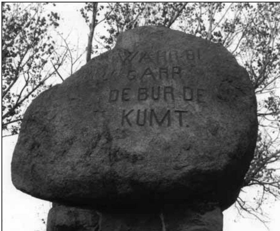
Den tonstunge vandreblok med indskrift, som topper mindesmærket for Ditmarskerfelttoget år 1500. Det blev rejst år 1900 i 400-året for ditmarskernes spektakulære sejr over kong Hans og hans hær ved ”Dusensdüwelswarf” – de tusinde djævles bakke på den smalle marskvej fra Meldorf til Hemmingstedt. Nu tror man, at ditmarskernes skanse var opkastet 800 m længere mod nord.

På den smalle vej var det umuligt for Garden at udfolde sig i sin sædvanlige brede kampformation, men landsknægtene prøvede alligevel et angreb efter at have lagt