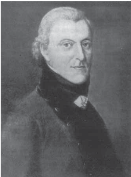
August Wilhelm Anton Neidhardt von Gneisenau (1760 - 1831). Deltog ved Saalfeld, Jena og Auerstedt 1806, hvor han såres. Forfremmes til major samme år. Efter sin indsats ved Kolberg fremmet til oberstløjtnant og medlem af den Militær-Reorganisationskommission, som genopretter den preussiske hær, så det forslår. Effekten af nyordningerne holdt sig til 1945. Da han betragtedes som "venstreorienteret", som følge af sine idéer om folkebevæbning, af kong Wilhelm III og de ledende kredse, fik han aldrig sin berettigede indflydelse eller de helt store militære poster betroet. Deltager som stabschef for Blücher ved Ligny og Waterloo, og er den der træffer beslutningen om at marchere Wellington til hjælp, i stedet for at trække sig tilbage mod nord for at holde hærens forbindelseslinier åbne. En ganske dristig beslutning, som afgør slaget ved Waterloo til Wellingtons fordel, hvor det ellers nok var gået galt. Ender som general-feltmarskal. Billedet er fra ca. ca 1800, og viser ham som kaptajn ved Füsilierbataillon von Rabenau i Jauer, Schlesien.

zist, hvilket faldt på beviserne. Meget belejligt omkom han så i stedet kort efter ved et biluheld!)