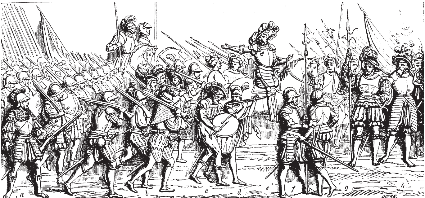
fig. 7. Frants I's franske hær med lejetropper. (Tegning efter Frants I's gravmæle). Til højre hellebardister, schweizerkaptajn og -fændrik.

Paven havde bekræftet Gardien i sin funktion, og denne anlagde atter en dragt i mediciernes blå, røde og gule heraldiske farver.