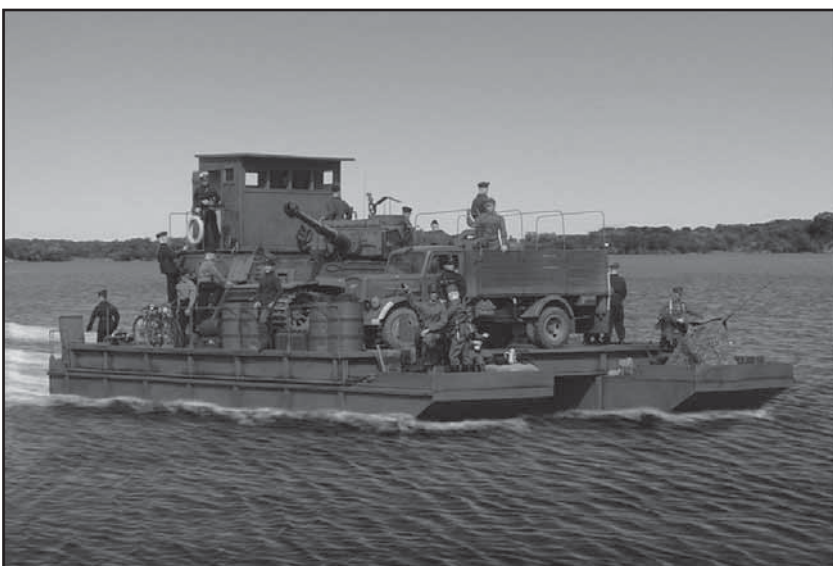
Forskellige militære scenarier bl.a: Siebel færge på vej over russisk flod med Tiger kampvogn, som besætningen er ved at klargøre. På færgen også 2 stk. Flak 38.