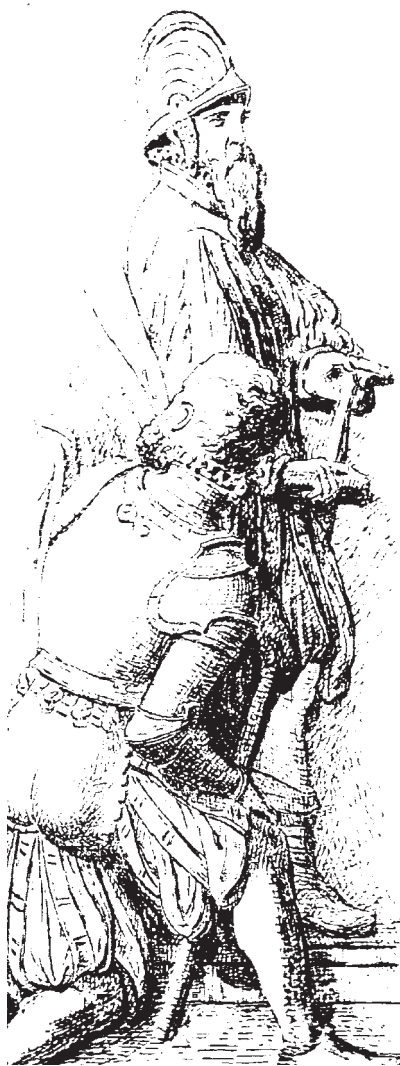
fig. 11. To gardister fra ca.1585 Udsnit af en tegning efter et halvrelieffet på Pius V's gravmonument.