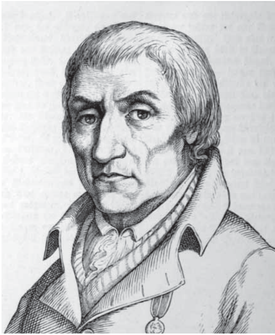
Jochim Christian Nettelbeck (1738 - 1824). En meget selvbevidst, rethaverisk og irriterende herre, men så afgjort den rigtige person på rette sted under belejringen af Kolberg 1807. Efter at have sejlet og drevet rederi gik han nødtvunget i land efter sit skibs forlis. Ernærede sig siden som brygger, fisker og lignende, men bestred også forskellige tillidsposter som borgeradjutant, brandchef og digemester.