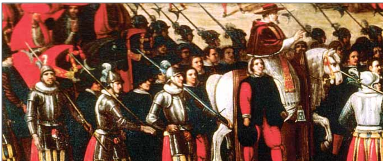
fig. 14. En procession med Urban VIII omgivet af Gardien. Maleri af ukendt kunstner fra midten af det 17. århundrede, Museo di Roma.