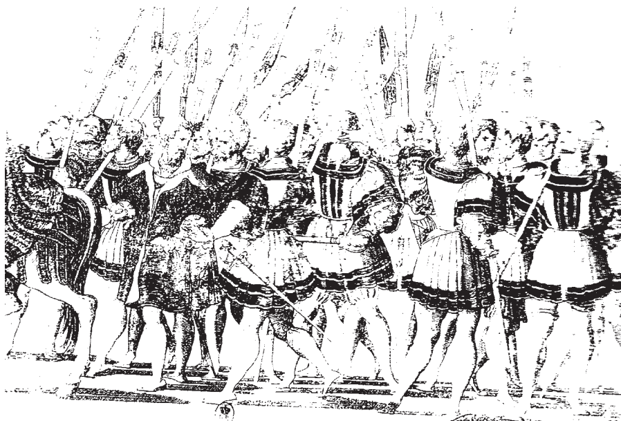
fig. 8. Custodia peditum Germanorum , Pavens tyske garde, efter radering af Hogenberg (1500-1539).

I mellemtiden marcherede rigsfeltherren, Charles de Bourbon, med 10.000 kejserlige spanske tropper og den berømte tyske landsknægtfører, Feldhauptmann Georg von Frundsberg 22 , med 12.000 tyske protestantiske landsknægte mod Rom. Da der forlød det rygte, at en våbenhvile var blevet afsluttet, gjorde de oprør mod deres generaler, som ikke kunne bevare disciplinen. De havde ikke modtaget sold i lang tid, led af sult og kulde, og frygtede at deres mulighed for plyndring skulle gå tabt. Dertil kom, at de protestantiske landsknægte var opfyldt af religiøst had mod den katolske kirke og pavemagten. Den 6. maj om morgenen stormede de Rom, som kun var svagt forsvaret. De trængte ind i byen, hvor de dræbte og røvede, hvor de kom frem. Ved Porta della Fornac stod en del af Schweizergarden. Trods kraftig modstand kunne den ikke holde fjenden tilbage; mange faldt og kom-