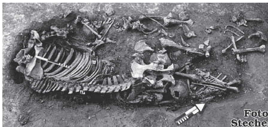
På dette foto fra en udgravning ser man dele af et hesteskelet og oven over pilen en hjerne-skål sammen med talrige knoglerester efter mennesker. Skeletrester efter otte unge mennesker og en hest lå tæt sammenpakket i en grav lige ved siden af landevejen.

Heldigvis har de kritiske militærfolks mere nøjterne tal vundet hævd hos senere historikere. Selv i Ditmarsken, hvor man naturligvis mindes slaget ved Hemming-