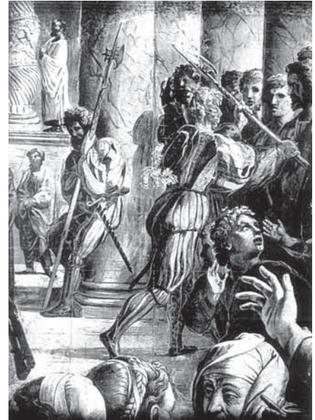
fig. 6. Hellebardist. Efter en freske af Penni fra ca. 1524.

I december 1521 døde Leo X pludseligt (måske forgivet!), og Schweizergarden sikrede atter pavepaladset mod overgreb. Efterfølgeren som pave blev Adrian VI (Adrian Florensz fra Utrecht). Som livvagt bevarede han Schweizergarden, der af kardinalerne rostes for dens "troskab, tapperhed og samhörighed med den Romersk-Katolske kirke". Det antages, at farverne i Gardien dragt blev ændret til den nye paves familievåben (grøn/sølv/guld), men under de betrængte finansielle omstændigheder er dette ikke givet. Ligeledes på grund af den akutte pengemangel måtte korpset i Trasteverekvarteret hjemsendes, og det uden at deres sold blev betalt. Under sit korte pontifikat søgte Adrian VI forgæves at indføre nogle tiltrængte kirkelige reformer, men mødte stærk modstand i Italien. Ej heller lykkedes