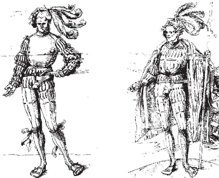
fig.1. En pikener og kaptajn fra ca. 1500 efter et samtidigt kobberstik af Niklaus Manuel Deutsch.

Kardinal Giulian della Rovera blev i 1503 valgt til pave 11 og tog navnet Julius II. Han havde medvirket til at skaffe schweiziske tropper til det franske felttog mod Neapel og var bekendt med deres duelighed. Lunefuld og selvsk, som han var, havde han fået øgenavnet " il terrible " og skaffet sig mange fjender. Han nærede ingen tiltro til knægtene, der havde tjent hans forgænger og Borgiaerne 12 , og besluttede sig derfor som sin livvagt at hverve schweizere, der alene ville være ham personligt hengivne. Derfor henvendte han sig til Peter von Hertenstein, ærkediakon ved domkirken i Sion, en af hans faste tilhængere, for at lade ham rekruttere det nødvendige antal lejetropper. Denne fore-