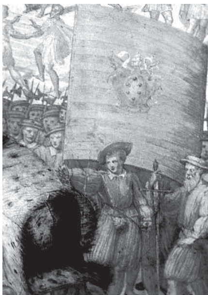
fig. 3. Fane fra Pius IV's pontifikat med medicifamiliens våben. Efter en fresken af Giuseppe Ponta (1520-75) i Sala Regia i Vatikanet.