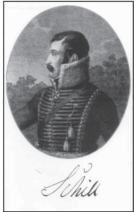
Ferdinand Baptista von Schill (1776 - 1809). Faderen var frikorpsfører under 7-årskrigen, og sønnen slægtede ham på i natur og opførelse. Som følge af sin udisciplinerede optræden var han den ældste sekondløjtnant i den preussiske hær, da krigen brød ud i 1806. Han såres ved Jena, men redder sig tilbage via Magdeburg og Stettin til Kolberg, hvor han af kongen personligt bemyndiges til at oprette og føre et strejfkorps af husarer og jægere, finansieret personligt af kongen. Og så var von Schill i sit rette element. Som følge af sin indsats ved Kolberg 1807 forfremmes han med springadvancement til major og regimentschef for 2. Brandenburgske Husarer. Den 10. december 1808 rykker von Schill i spidsen for den preussiske hær ind i Berlin under befolkningens larmende jubel. 1809 gik det galt, og han dræbes i Stralsund under sit håbløse oprørsforsøg.

Man kan i noget af dialogen finde nogle af Goebbels mere berømte og genkendelige ord og sætninger fra feks. den berømte tale i Sportpalast, den 18. februar 1943, afholdt i forbindelse med nederlaget ved Stalingrad,