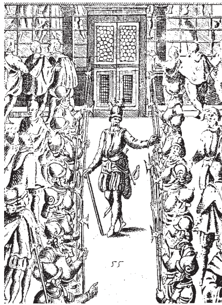
fig. 10. Schweizergarden opmarcheret i det Sixtinske Kapel i Rom. Stik af du Pérac 1578.

Paven havde besluttet, at Garden skulle iføres Farneseslægtens blå og gule farver. Fra regnskabsbøgerne ( Mandati Camerali ) fra 1548 fremgår det, at der blev indkøbt 226 canne og 1 palmo (ca. 527 meter) stof fra Conservatorio delle Mendicanti til 201 mand, blåt og gult med rødt for, desuden sort silkestof til løjtnanten, fændriken og skriveren. Bevæbningen var hellebard og sværd; desuden havde Garden ved særlige lejligheder og under krigsforhold båret en halvrustning og hjelm ( morion ), og ud over den almindelige bevæbning var nogle for-