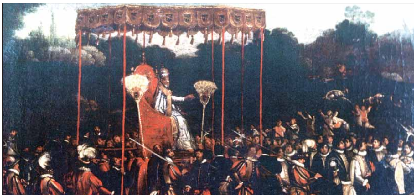
fig. 12. En procession fra 1598. Clement VIII omgivet af Gardien. Maleri af Antonio Tempesta (1555-1630), Palazzo Barberini.